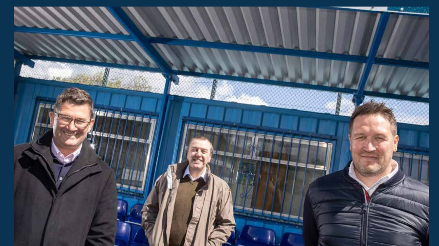
Rhodd Pennant Walters o £13,000 i Glwb Pêl-droed Rhondda ar gyfer eistedd newydd 60 sedd