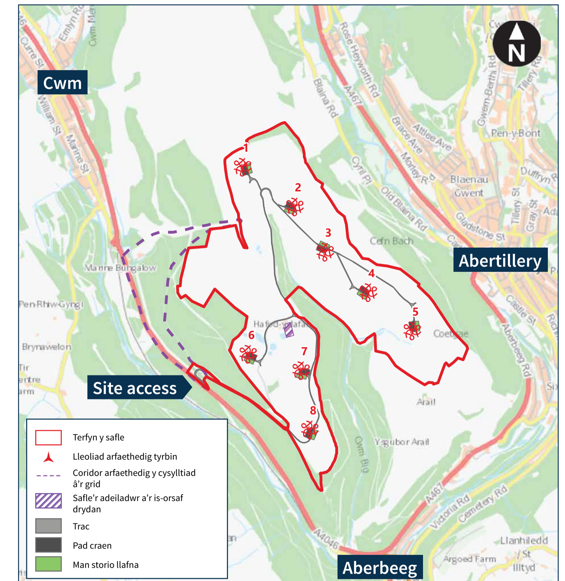
Cynllun fferm wynt arfaethedig

Mae Mynydd Carn-y-Cefn hefyd yn elwa o fynediad da i'r rhwydwaith priffyrdd ac i'r rhwydwaith dosbarthu trydan. Mae cynnig o gysylltiad â'r grid gan Western Power Distribution (WPD) wedi'i dderbyn. Bydd llinell 33kV rhwng yr is-orsaf ar y safle a'r grid trydan yng Nghrymlyn yn destun cais ar wahân. Bydd angen cydsyniad eilaidd i ddargyfeirio tri hawl tramwy cyhoeddus pan fydd y fferm wynt yn cael ei hadeiladu a phan fydd yn weithredol.