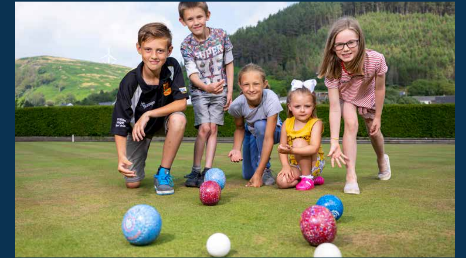
Clwb Bowls Cwm Ogwr yn targedu aelodaeth ieuenctid gyda £8,000 oddi wrth Pennant Walters

Gan mai cwmni Cymreig yw Pennant Walters, bydd y Fferm Wynt mewn perchnogaeth leol. Fodd bynnag rydym hefyd yn ystyried cyfleoedd ar gyfer elfen o gydberchnogaeth gyda'r gymuned leol.